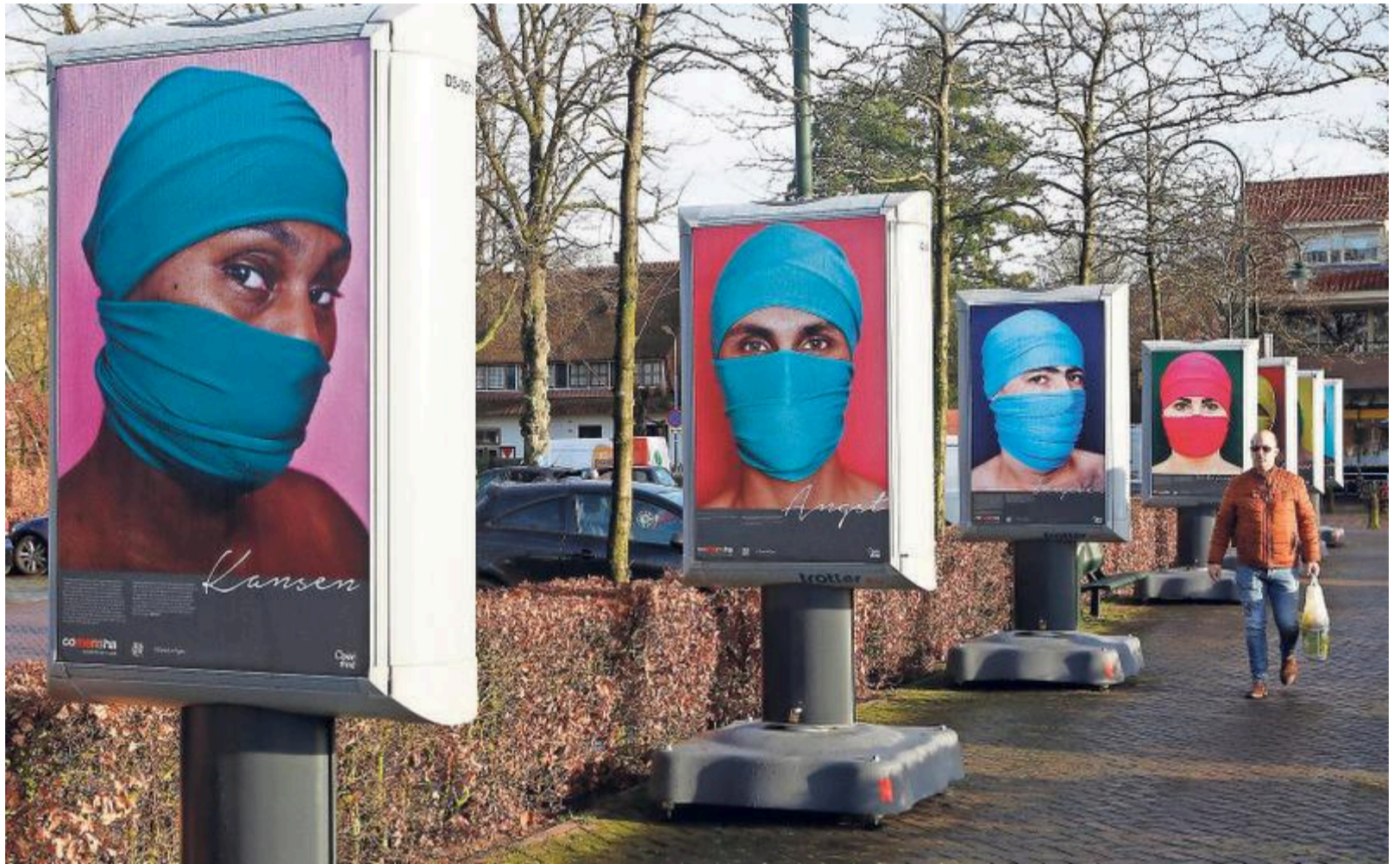
Veel leerlingen hadden de expositie 'Open je ogen' over mensenhandel die nu in Laren staat gezien.

College de Brink is de eerste school in de regio die 'ja' heeft gezegd tegen de aangeboden gastlessen. „We vinden het een belang-